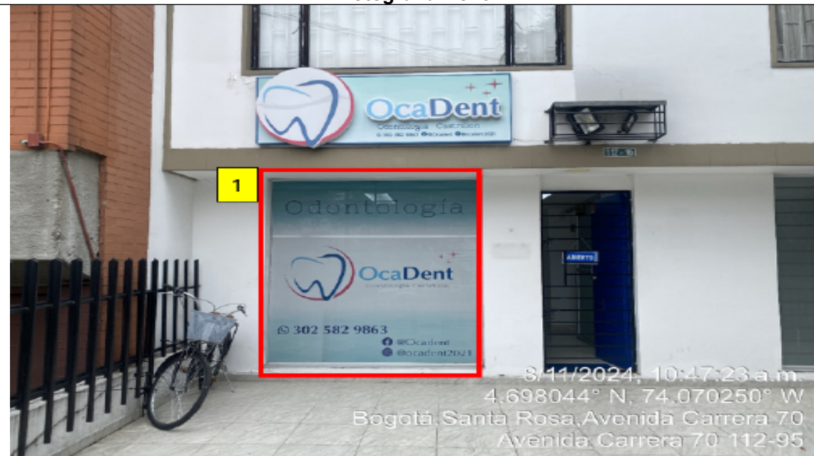
Fotografía No. 3

En la cual se evidencia un (1) elemento PEV incorporado a la ventana de la edificación, identificado con el número 1.