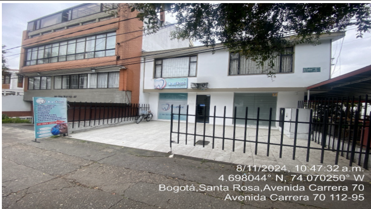
Fotografía No. 1

Vista panorámica del predio donde se encuentra ubicado el establecimiento OCADENT, AK 70 No. 112 – 95 de la localidad de Suba.