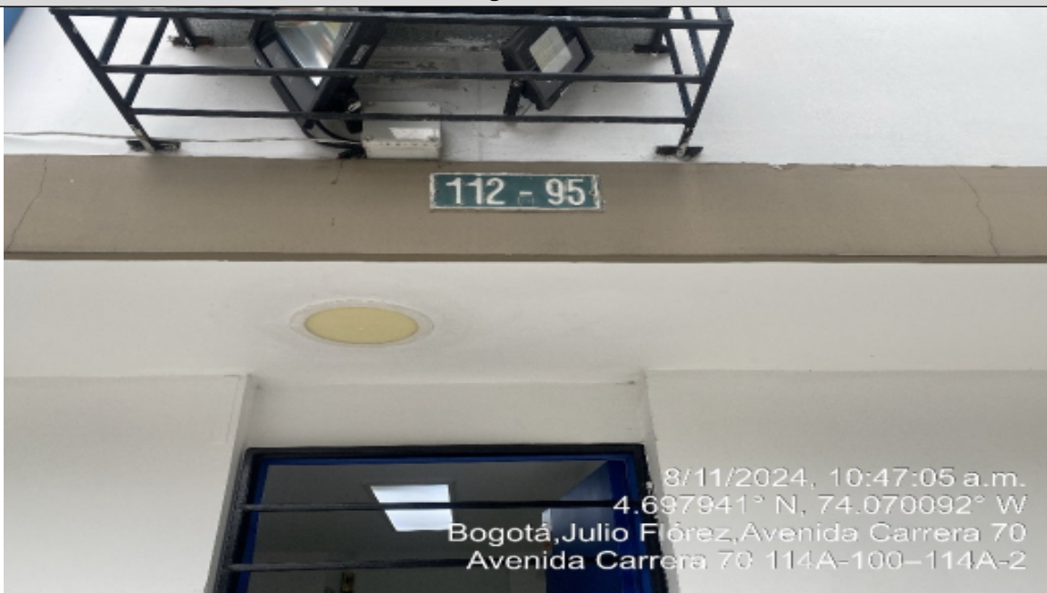
Fotografía No. 2

En la que se observa la nomenclatura urbana de la propiedad donde se encuentra el establecimiento OCADENT.